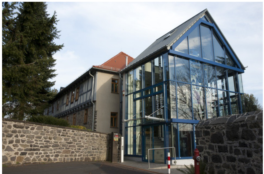
Museum im Spital Grünberg