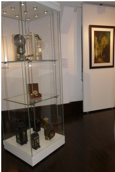
Tritt ein Besucher an das Bild "Eingeschlafener Nachtwächter" von Carl Spitzweg heran, spielt Codespot Pro das Nachtwächterlied.

„Für die Sonderausstellung ‚Licht ins Dunkel‘, die vom 12. Dezember 2014 bis 22. März 2015 im Museum im Spital Grünberg gezeigt wird, suchten wir nach einer Möglichkeit, Besuchern in einem bestimmten Bereich der Ausstellung das Nachtwächterlied ‚Hört Ihr Herrn...‘ als Hintergrundmusik vorzuspielen.